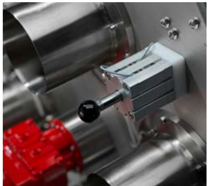
Exact alignment between ports and internal swan neck.