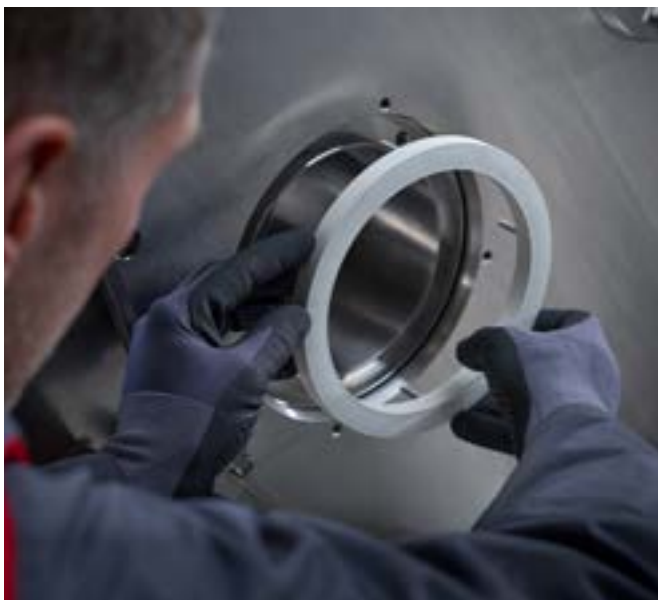
Easily change the seal without the need to remove the factory piping.